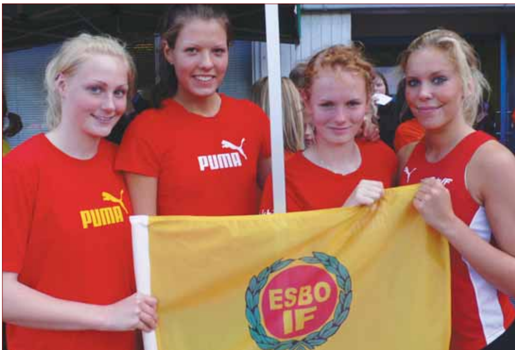
Framgångsrika Esbo IF flickorna i FM stafett 4x300m D17 hämtade brons. Esbo IF:n tytöt toivat pronssia SM viestissä 4x300m N17.